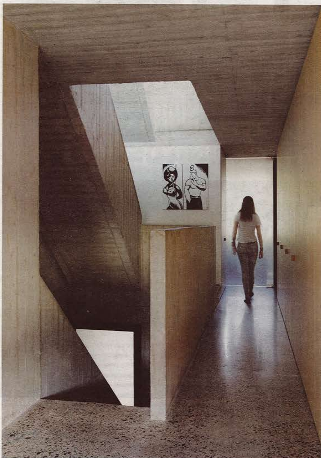
Overal in de woning mag beton gewoon beton zijn, zonder extra afwerking. De vloer werd gepolierd.