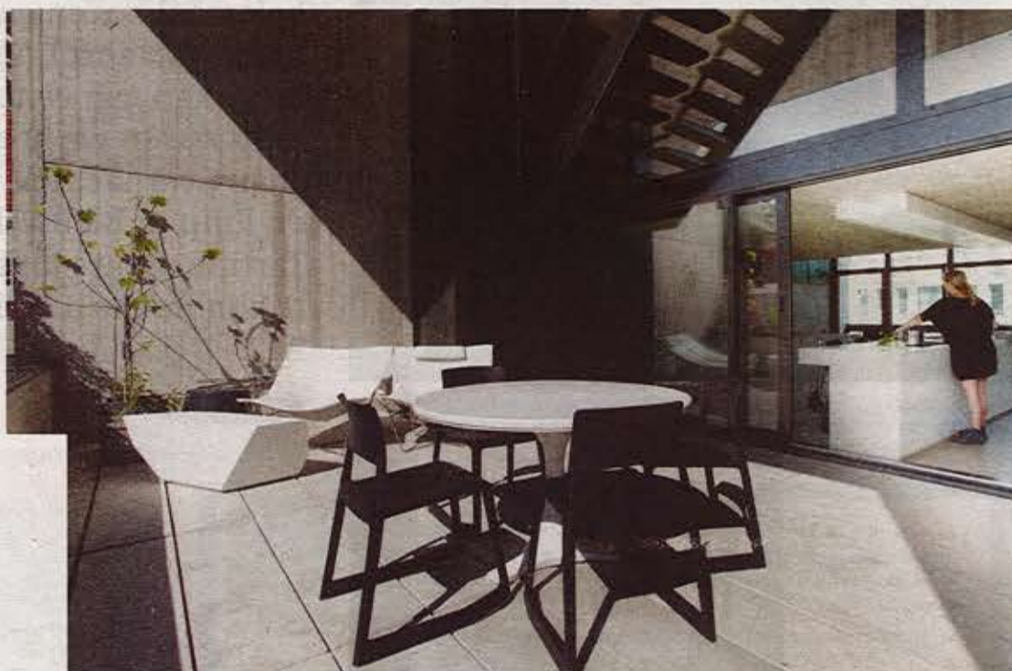
Bij de leefruimte sluit een ruim terras aan met bloembakken waarin Ilze kruiden en groenten kweekt.

'Gestapelde stad', zoals het project officieel heet, won een duurzaamheidsprijs en werd opgenomen in het Buitengewoon Belgisch bouwboek omdat in het ontwerp de wensen van de bewoners, de vormgeving, het materiaal en het interieur samensmelten tot een uniek geheel.