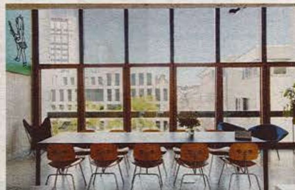
Hoge leefruimtes en transparantie doen het gebouw heel ruim en licht aanvoelen.