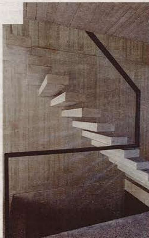
Doordachte doorkijken brengen licht tot in het hart van het gebouw.